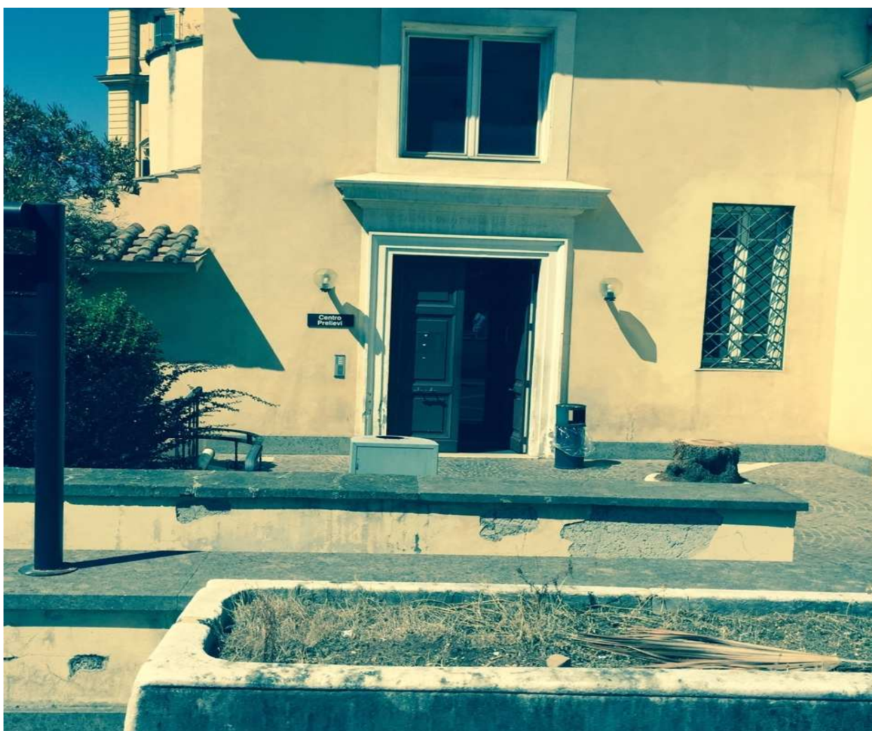
Foto 1: Centro Prelievi “Corpo L” Via San Giovanni in Laterano, n. 155