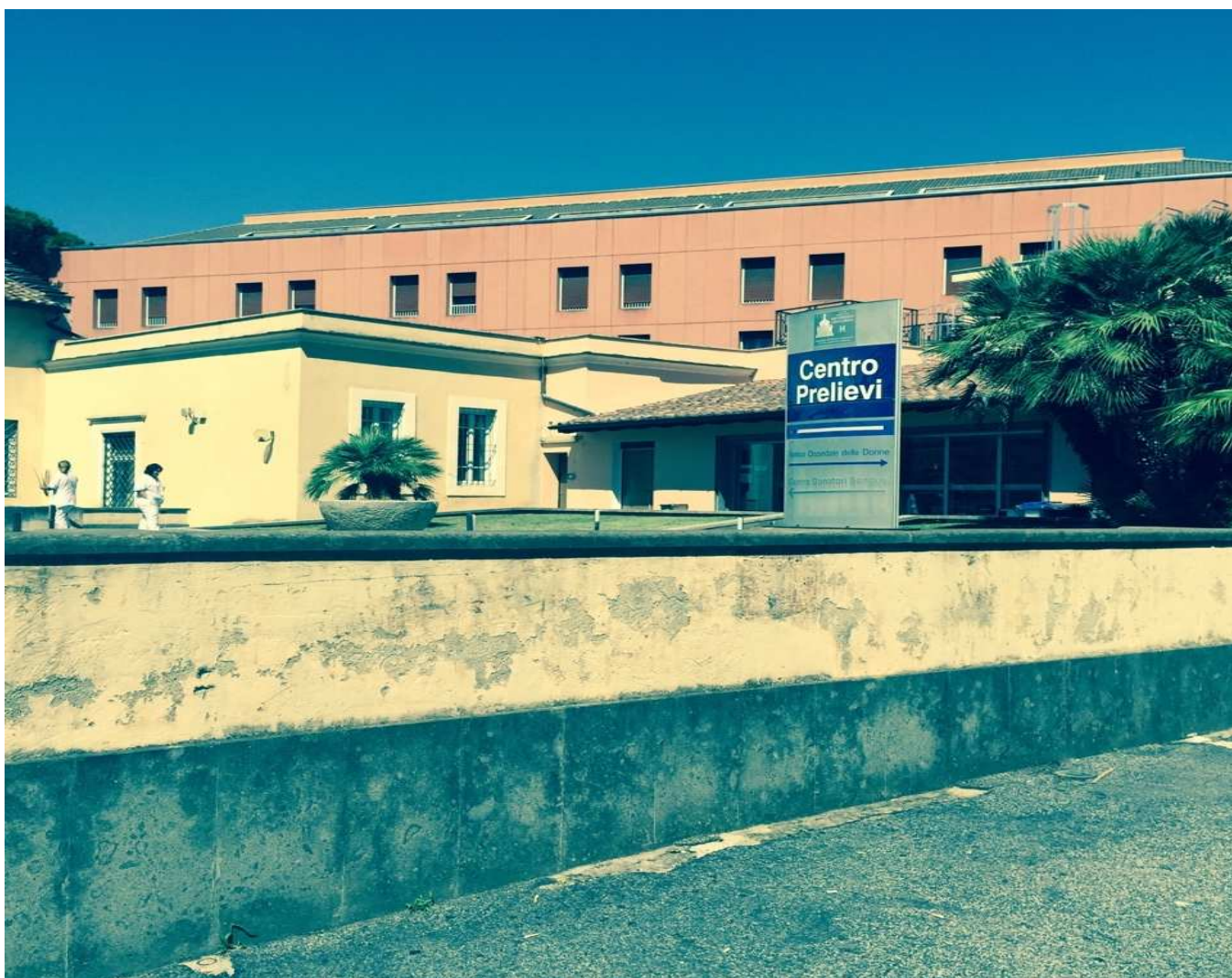
Foto 2: Ingresso Centro Prelievi via San Giovanni in Laterano n.155

Questo manuale descrive l'attività e le procedure del Centro Prelievi dell'UOC Patologia Clinica dell'Azienda Ospedaliera San Giovanni Addolorata, rappresenta uno strumento pratico, rivolto agli operatori del servizio, utile anche ai cittadini utenti che vi troveranno molteplici informazioni (la dislocazione dell'ambulatorio, le modalità per raggiungerlo, le modalità del prelievo ematico, la raccolta di altri campioni biologici, modalità di refertazione). Tutto questo per fare in modo che le informazioni ottenute con gli esami di laboratorio possano essere di concreto aiuto nel definire gli stati di salute o di malattia dei singoli utenti o nel monitoraggio di patologie già note. L'obiettivo è di migliorare nel tempo tale strumento anche con l'utilizzo delle indicazioni fornite dagli utenti.